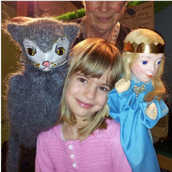
Lisbeths Aufführungen begeisterten Jung und Alt.