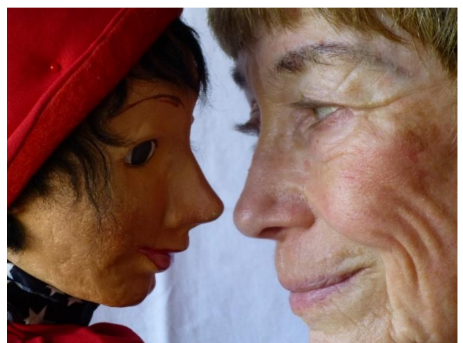
Und die beiden blieben sich treu bis 2016. (Und sind es wohl heute noch, nur treten sie nicht mehr auf!)